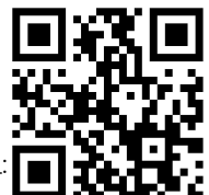
칼럼 전문 QR 코드: